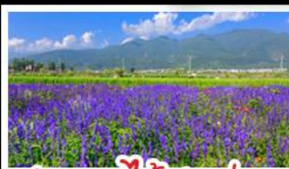
สวนดอกไม้ฮาวอวู๋ผ่าง