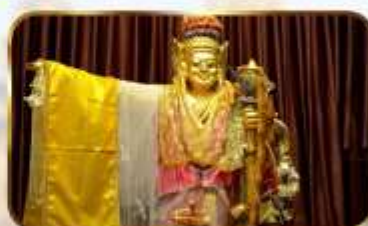
เทพทั้นใจโจ้เข้า