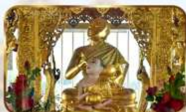
ขอพระพระอุปคุต ปางจกบาตริเยียมาร