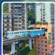
รถไฟฟ้า-ลุมพิก