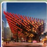
พิพิธภัณฑ์ศิลปะตะกั่วถ้ำ