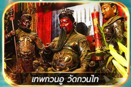
เทพกวนอู วัดกวนไท

พามุไหว้พระขอพร 8 วัดดัง, อิสระช้อปปิ้ง 1 วันเต็มแบบจุใจ