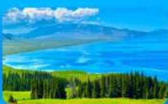
ทะเลสาบไซ่หลี่มู่