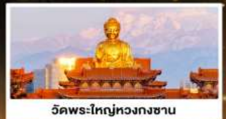
วัดพระใหญ่หวงกงซาน