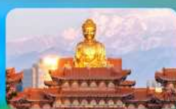
วัดพระใหญ่หวงกงชาน