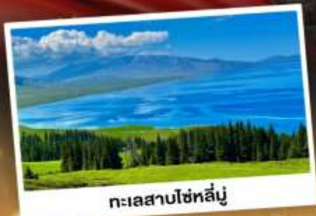
ทะเลสาบไซท์สีมู่

ชมวิวดอกดอกลังการแบบยุโรปผสมเอเชีย กุ้งหนุ่ยเขียวดำ ทะเลสาบสีเทอร์ควอยซ์