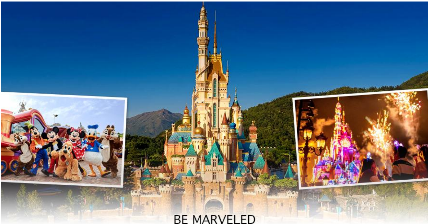
BE MARVELED HONG KONG DISNEYLAND

☺️ อาหารเช้าเที่ยงและอาหารเย็น เพื่อความสะดวกในการช้อปปิ้ง