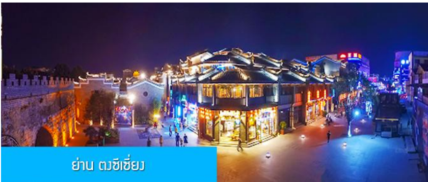
ย่าน ตงซีเจียง

จากนั้นนำท่านเที่ยวชม พิพิธภัณฑ์ดอกกุยฮวา 桂花公社 ดอกกุยฮวาเป็นดอกไม้สีเหลืองที่มีกลิ่นหอม เป็นดอกไม้ประจำเมืองของกุยหลิน จะเบ่งบานในช่วงเดือนมิถุนายน – กรกฎาคมของทุกปี ในช่วงที่ดอกกุยฮวาเบ่งบานในเมืองกุยหลินจะคลุ้งไปด้วยกลิ่นหอมจากดอกกุยฮวา ทั่วเมืองกุยหลินจะเต็มไปด้วยสีเหลืองของดอกกุยฮวา ดอกกุยฮวาสามารถนำมาแปรรูปเป็นอาหารและเครื่องดื่มได้ และได้รับความนิยมจากชาวจีนตอนใต้เป็นอย่างมาก ชมพิพิธภัณฑ์ที่ทันสมัยด้วยระบบจัดแสดงที่ทันสมัย ภายในพิพิธภัณฑ์มีความโอ้อ่า มีการสาธิตและจำหน่ายผลิตภัณฑ์ที่ทำจากดอกกุยฮวา อาทิ ขนมดอกกุยฮวา ชาที่ทำจากดอกกุยฮวา และสินค้าพื้นเมืองอื่น ๆ