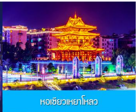
หอชิวเหยาไหล