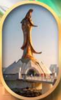
เจ้าแม่ทอมอริมทะเล