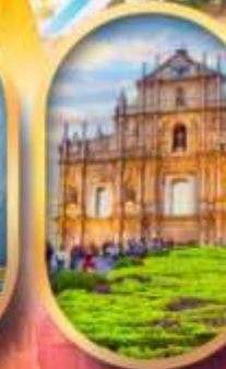
โบสถ์เซนต์พอล