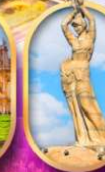
เด็กหญิงชาวประมง