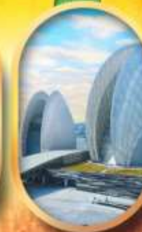
โรส-ครีซมุก