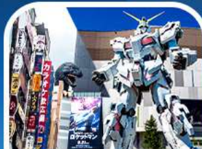
ช้อปปิ้งชินจูกุ+กันดั้มยักษ์