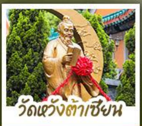
ว้ดแ่ว้งถ้ำเซ้าเซ้า