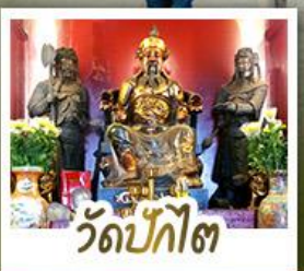
ว้ดปี้กไต้