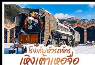
โรงเก็บข้าวฉัตร, เจียงเต่าเซอจื่อ