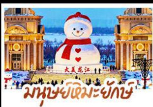
มนุษย์หิมะยักษ์