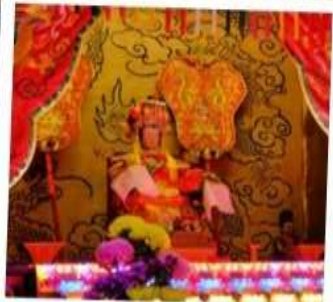
เจ้าแม่ทับทิม จอสเฮ้าส์เบย์