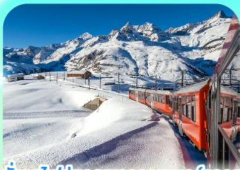
นั่งรถไฟสุดงดงามรอบนอร์แตร