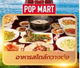
อาหารสไตล์กวางตุ้ง