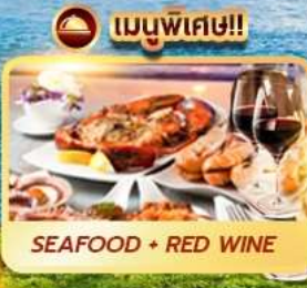
SEAFOOD + RED WINE