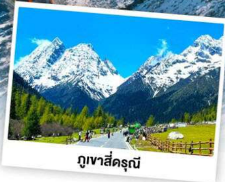
กุเวาสีครุณี

เดินทางโดย: สายการบินเจิงตูแอร์ไลน์ (EU)