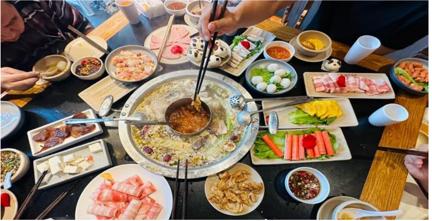
คำ รับประทานอาหารคำ ณ ภัตตาคาร (เมื่อที่ 12) *เมนูพิเศษสุกี้หมอลำเสฉวน