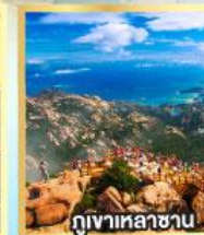
กุหาเหลาซาน