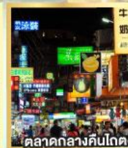
ตลาดกลางคืนโกตง