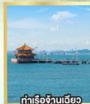
ท่าเรือจันทิว