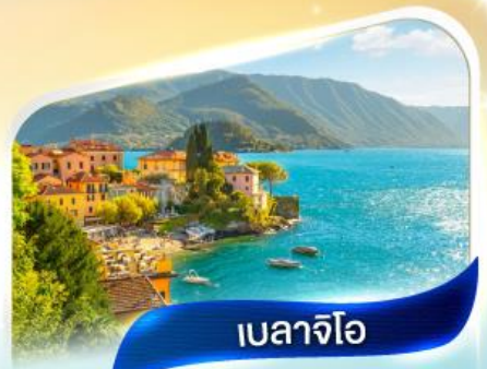
เบลาจีโอ