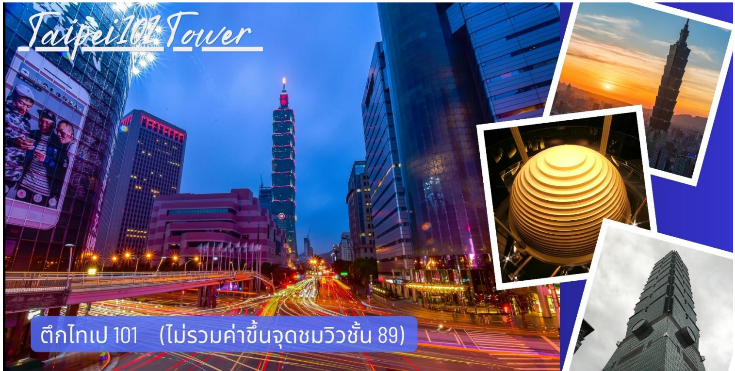
ตึกไทเป 101 (ไม่รวมค่าขึ้นจุดชมวิวชั้น 89)

เย็น ** อีสรระอาหารเย็นเพื่อความสุขสานอย่างต่อเนืองให้ท่านเล็กรอรรอยตามสไตล์ที่ท่านโปรด** แวะช้อป ชิม ซิลล์" จบในที่เดียวที่ Mitsui Outlet Park สนุกกับกิจกรรมหลากหลายสำหรับทุกคนใน ครอบครัว สวรรค์ของคนรักแบรนด์เนม ครบทุกไลฟ์สไตล์ สินค้าแบรนด์ดังระดับโลกกว่า 200 แบรนด์ ทั้ง แฟชั่น อุปกรณ์กีฬา และของใช้ในบ้าน ลดสูงสุด 30-70% ทุกวัน! อิ่มอร่อยกับร้านอาหารชื่อดังจากญี่ปุ่น และไต้หวัน สมควรแก่เวลานำท่านออกเดินทางสู่ สนามบินเถาหยวน Taoyuan International Airport (TPE) เช็คอินสัมภาระใต้เครื่อง ไม่เกิน 23 กก. กก./ท่าน** 22.30 น. ออกเดินทางกลับสู่ ประเทศไทย โดยสายการบิน CHINA AIRLINES เที่ยวบินที่ CI837 | TPE-BKK (22.30- 01.35 (+1) *มีอาหารบริการบนเครื่อง* 01.35 น.+1 เดินทางถึง กรุงเทพฯ (สนามบินนานาชาติสุวรรณภูมิ) Suvarnabhumi Airport (BKK) อย่างปลอดภัยโดย สวัสดิภาพ