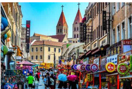
ถนนางซาน