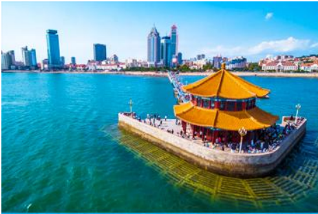
สะพานจ้านเจียว