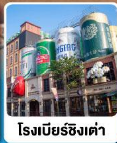
โรงเบียร์ชิงเต่า