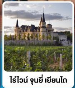
ไร่ไวน์ จุนยี่ เยียนไถ