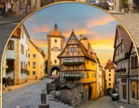
เพลินไลน์