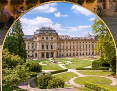
พระราชวังแวร์ซายส์ ฝรั่งเศส