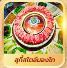
สุกใสโตลมองโก