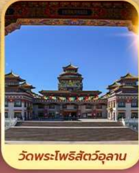
วัดพระโพธิสัตว์อูลาน