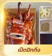
เปิดปอกทั้ง