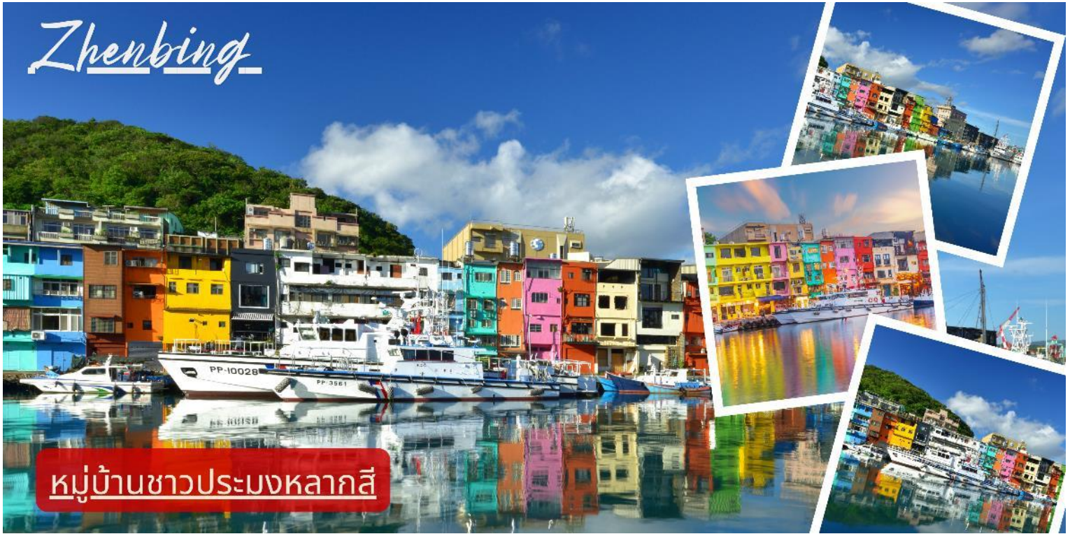
หมู่บ้านชาวประมงหลากสี

เยี่ยมชม หมู่บ้านชาวประมงหลากสี Zhenbing ซึ่งสะท้อนถึงการพัฒนาชุมชนริมทะเลแบบยั่งยืน บ้านเรือนสีสันสดใสและบรรยากาศริมทะเลช่วยให้ผู้มาเยือนได้เรียนรู้เรื่อง วัฒนธรรมชุมชนประมงและภูมิสถาปัตยกรรมท้องถิ่น