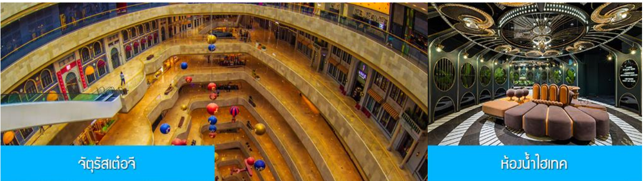
จัตุรัสเต๋อจี