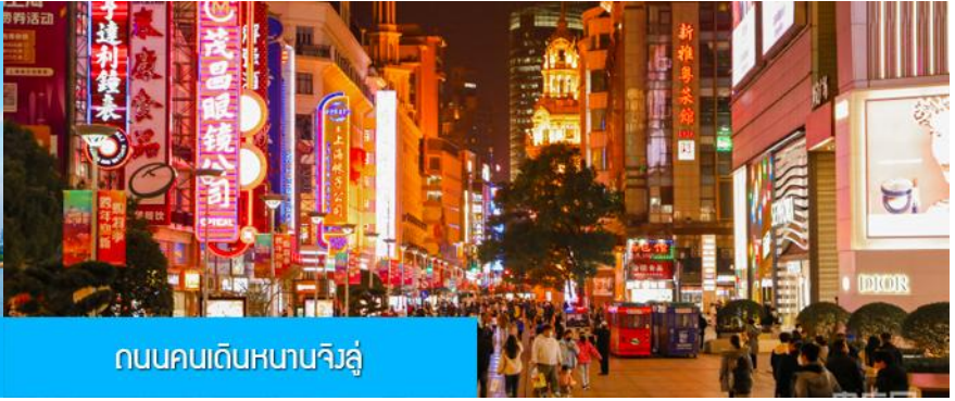
ถนนคนเดินหนานจิงลู่

จากนั้นนำท่านเดินทางสู่ ย่านช้อปปิ้งที่ใหญ่และคึกคักที่สุดของมหานครเซี่ยงไฮ้ ถนนคนเดินหนานจิงลู่ 南京路步行街 ให้ท่านเพลิดเพลินกับการเดินเที่ยว ชม และ ช้อปปิ้ง ชิมอาหารหรือของท่านเล่นอย่างจุใจ ในย่านถนนคนเดินนี้ นอกจากร้านค้าสินค้าแบรนด์เนมจากต่างประเทศแล้ว สินค้าแฟชั่น และสินค้าแบรนด์จีนก็มีให้เลือกอย่างมากมาย ร้านอาหารและเครื่องดื่มก็มีให้เลือกนั่งเลือกชิมมากมาย..