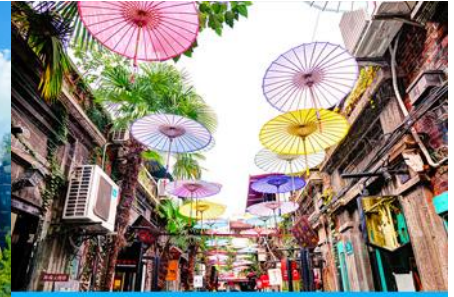
ย่านเทียนจื่อผา