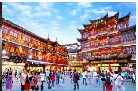
ย่านเจิงหวงเมี้ยว