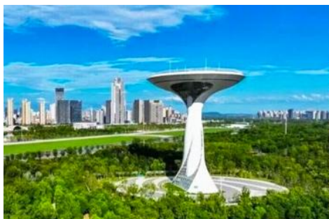
สวนสาธารณะลั่วกั๋ว

เช้า รับประทานอาหารเช้า ณ ห้องอาหารของโรงแรม (8)