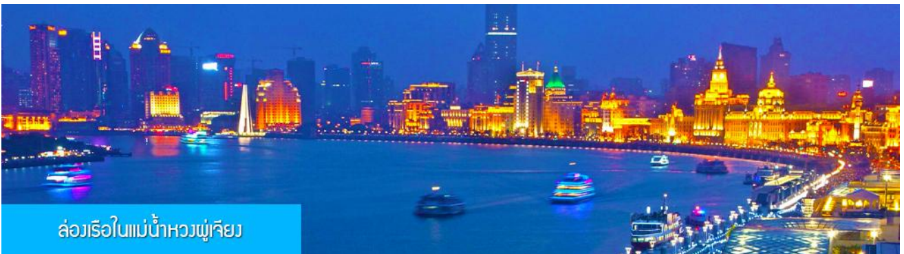
ล่องเรือในแม่น้ำหวงผู่เจียง