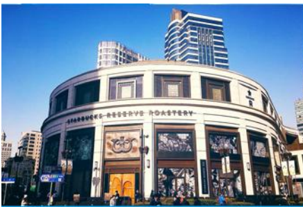
Starbuck Reserve Roastery

รับประทานอาหารเช้า ณ ห้องอาหารของโรงแรม (3)