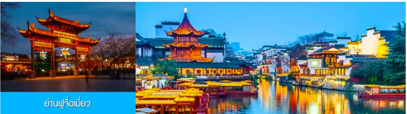
ย่านฟูจื่อเมี่ยว