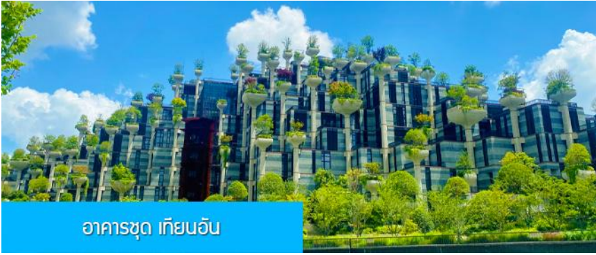
อาคารชุด เทียนอัน