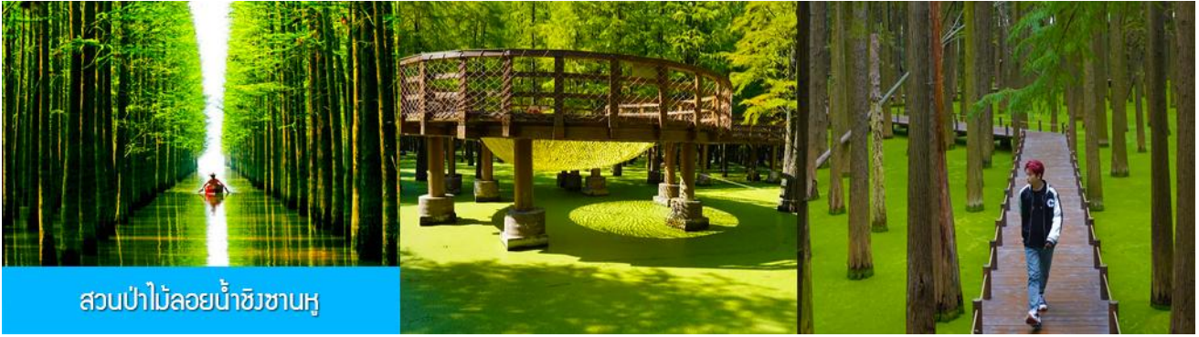
สวนป่าไม้ลอยน้ำชิงชานหู