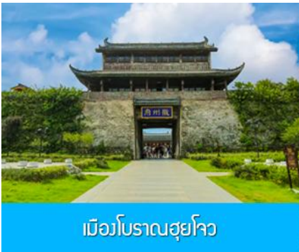
เมืองโบราณฮุยโจว

เช้า รับประทานอาหารเช้า ณ ห้องอาหารของโรงแรม (1)