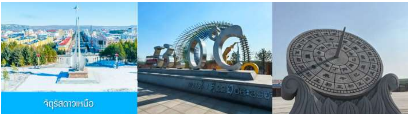
จัตุรัสดาวเหนือ