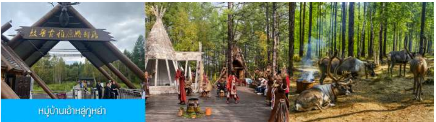
หมู่บ้านเอ้อเอ่อกู่หย่า