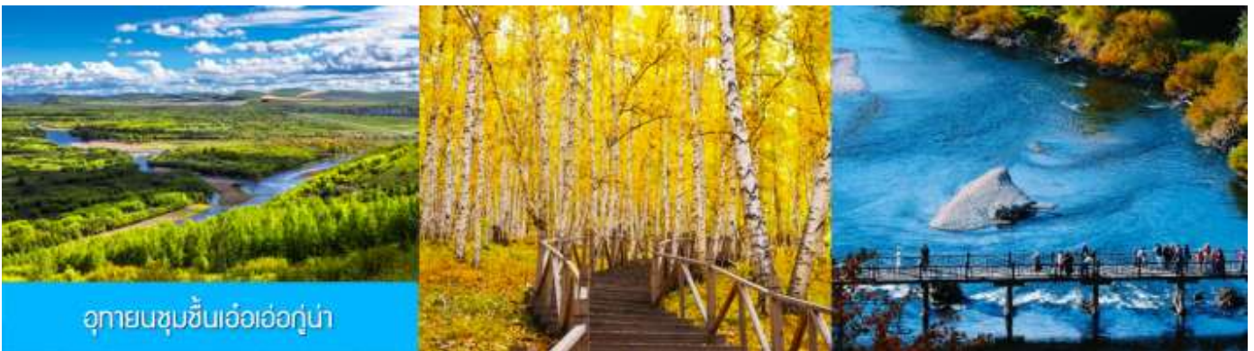
อุทยานชุ่มชื้นเอ้อเอ่อกู่หน้า

เช้า รับประทานอาหารเช้า ณ ห้องอาหารของโรงแรม (16)