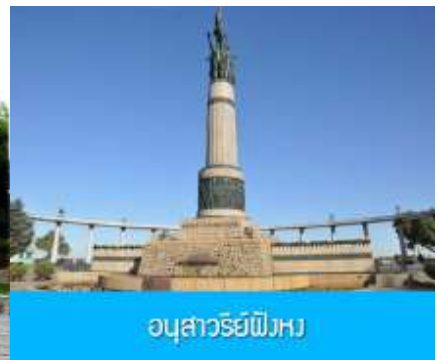
อนุสาวรีย์พิงหวง