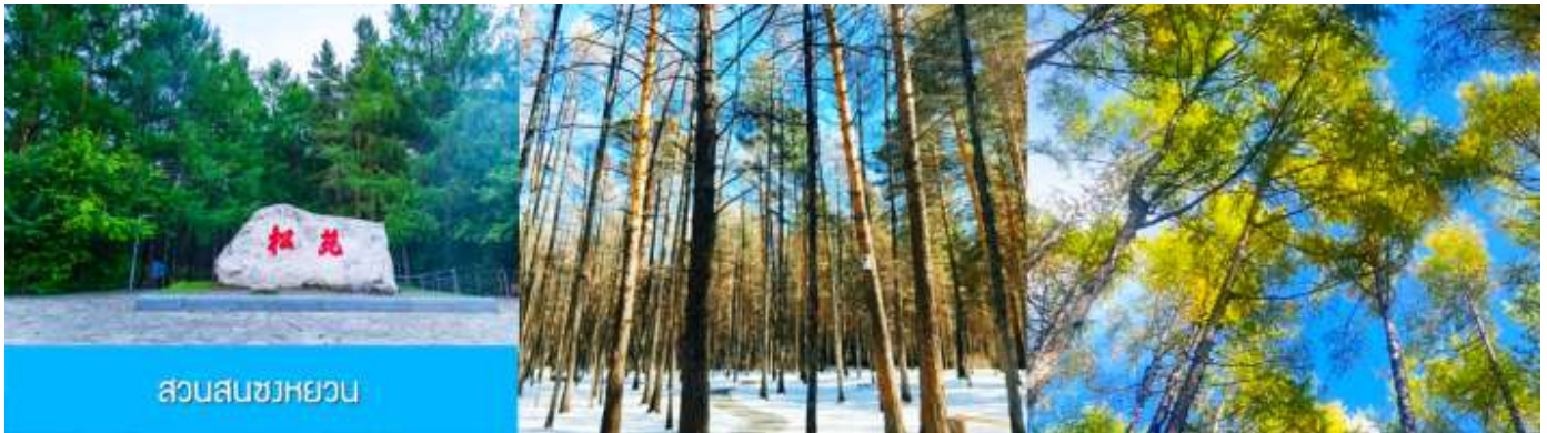
สวนสนขงหยวน

เช้า รับประทานอาหารเช้า ณ ห้องอาหารของโรงแรม (22)