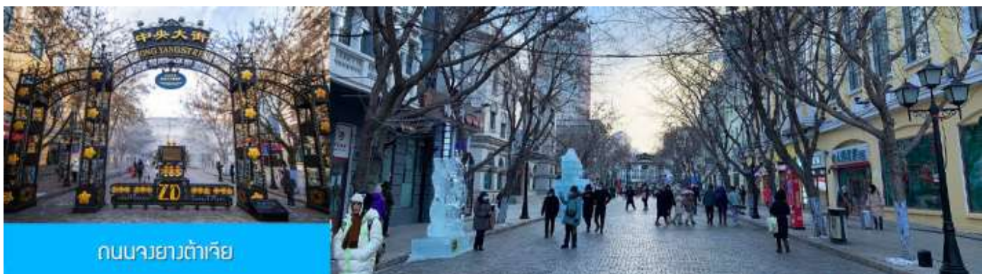
ถนนจงยางต้าเจีย