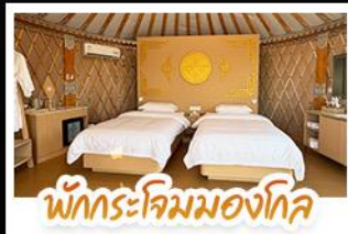
พักโรงแรมมองโกล

เที่ยวสบาย นอนหรูระดับ 5 ดาว เปลี่ยนลุคเป็นสาวมองโกลสุดชิค! ทริปนี้จัดให้แบบ V.I.P. เปิดประสบการณ์ พักโรงแรมมองโกลสุดพรีเมียม พร้อมนั่งกระเช้าและขี่อูฐไปตะลุยเนินทรายเสียงซาวาน เก็บครบทั้งไฮโซดและสุสานเจกิสถาน