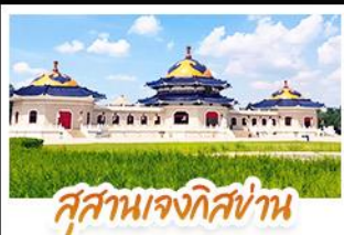
สุสานเจกิสถาน