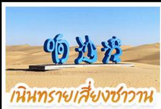
หินทรายเสียงซาวาน