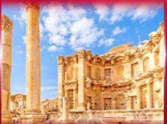
เมืองโบราณเพตรา