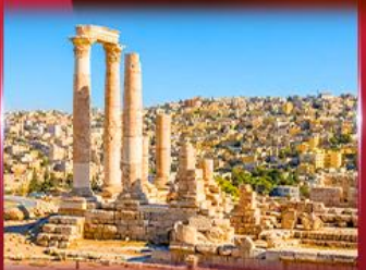
ป้อมปราการอันมาน