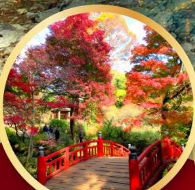
สวนดอกบ๊วยอาคางิ