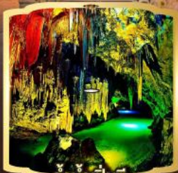
ถ้ำน้ำเป็นซี