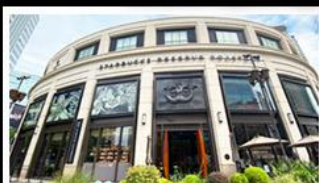
วัดพระหยก