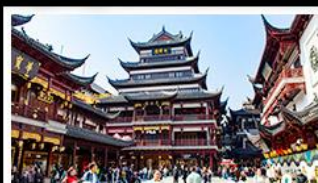
ตลาดร้อยปีเฉิงหวงเมี่ย