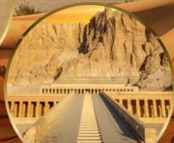
หุบเขากษัตริย์