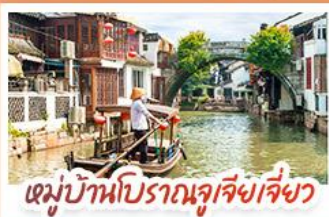
หมู่บ้านโบราณจูเจียงเจี๋ยว

สวนสนุกเซี่ยงไฮ้ดิสนีย์แลนด์ เต็มวัน (รวมรถรับ-ส่ง)