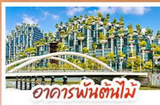
อาคารพันตันใหม่