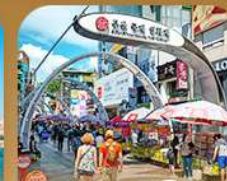
ตลาดนัมโพดง