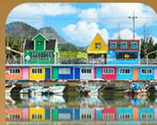
ท่าเรือจันนึม