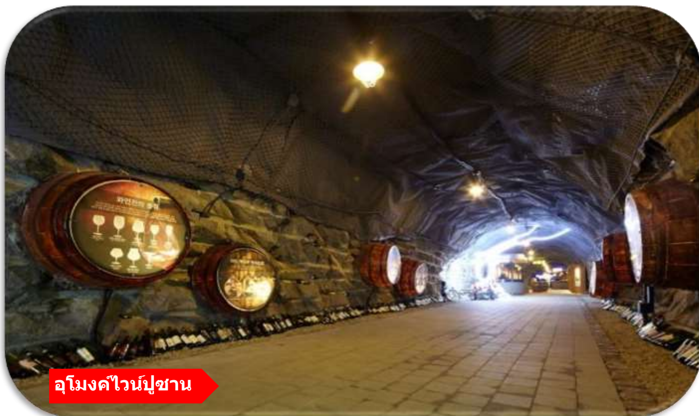
อุโมงค์ไวน์ปูซาน

เยี่ยมชม อุโมงค์ไวน์ปูซาน (Busan Wine Cave) เป็นอุโมงค์ไวน์สดซิคที่ตกแต่งด้วยแสงสีและงานศิลปะภายในถ้ำ บรรยากาศเย็นสบาย โรแมนติก และเหมาะกับการถ่ายรูปภายในมีโซนชิมไวน์ ผลิตภัณฑ์ท้องถิ่น และมุมจัดแสดงที่ผสมผสานความทันสมัยกับเสน่ห์ของอุโมงค์ใต้ดินได้อย่างลงตัว