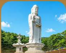
วัดดงซาซา

เปิดประสบการณ์เที่ยวเกาหลีสุดคุ้ม บินครั้งเดียว เที่ยวสองเมือง • เช็กอินถนนนักร้องคิมควังชอก สัมผัสเสน่ห์ศิลปะและเสียงเพลง • นั่งรถไฟปิ๊กชมวิวทะเลปูซาน • หมู่บ้านคิมซอนสีสดใสใ ก่อนเยือนวัดแฮดงยงกุงซาและวัดคยองซาซา เสริมความเป็นสิริมงคล • เวชสำอางเรือสีรุ้ง Bunezia ปิดท้ายด้วยช้อปปิ้งไฮแฟชั่นแดนคัมมาร์เก็ตชื่อดัง พร้อมเดินช้อปปิ้ง Walking Street สุดฟิว