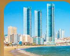
หาดแซอินแด