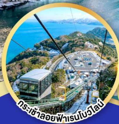
กระเช้าลอยฟ้าเรนโบว์ไลน์