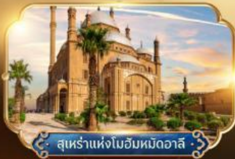
สุเหร่าแห่งโมฮัมหมัดอาลี