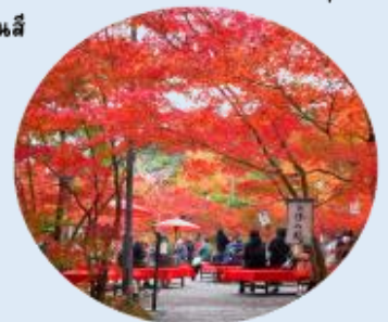
ที่ให้ภาพบรรยากาศท้องถื่นของลานหนึ่งสีแดง ที่ปกคลุมไปด้วยใบไม้เปลี่ยนสี