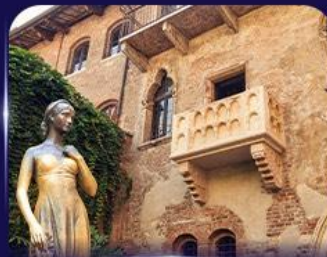
เขื่อนบ้านจูลีเยต เวโรนา