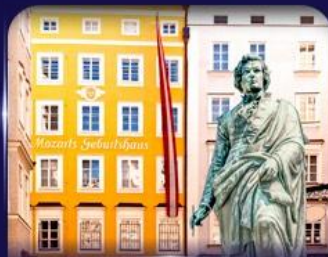
บ้านเกิดโมสาร์ท ซาลซ์บูร์ก