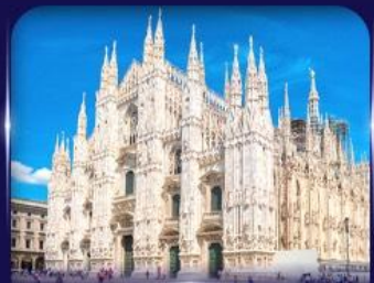
เซนต์มาร์กาเรต มิลาโน