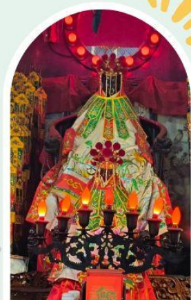
วัดเจ้าแม่กวนอิมองอ่า