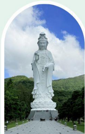
วัดเจ้าแม่กวนอิมซัน

"ไหว้พระ เสริมดวง เพิ่มสิริมงคลแก่ชีวิต"