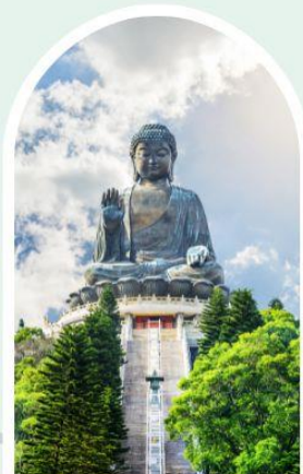
พระใหญ่โป่หลิน