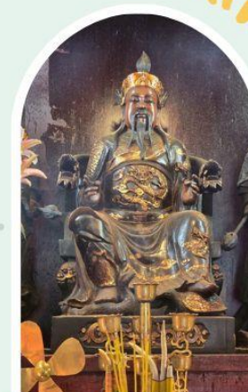
วัดปักไต้