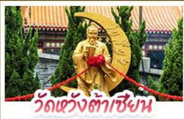
วัดเข่งต้าเซียน