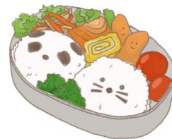
● อาหารสำหรับเด็ก ( 2-11 ปี ) *วัตถุดิบขึ้นอยู่กับทิวทัศน์