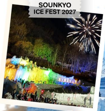
SOUNKYO ICE FEST 2027