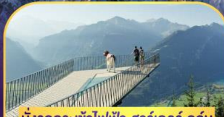
นั่งรถกระเช้าไฟฟ้า ฮาร์เตอร์ คูลัม