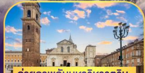
ถ่ายภาพกับมหาวิหารตูริน