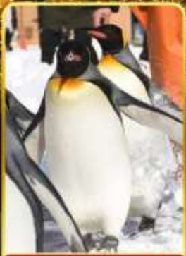
มิถุซามารีนพาร์ค