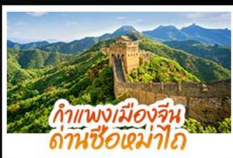
กำแพงเมืองจีน ด่านซือเม่าโต