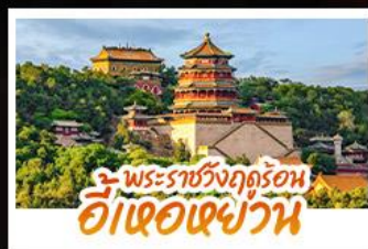
พระราชวังฤดูร้อน ฮ้อเจ้อเซ่ย่วน