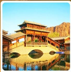
เมืองเล็กตันเสี่ยโซ่ว