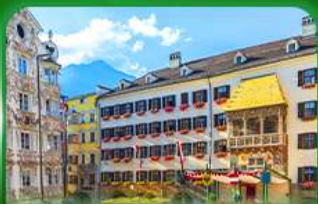
หลังคาทองคำ อินส์บรุค