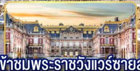
เจ้าชมพระราชวังแวร์ซายส์

พิเศษ!! รับประทานอาหารกลางวันบนเรือ พร้อมล่องชมแม่น้ำแซน