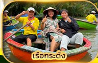
เรือกระดิ่ง