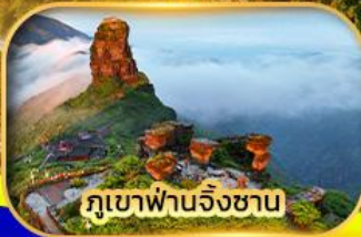
ภูเขาผานจิงซาบ