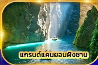
แกรนด์แคนยอนผิงซาบ