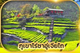
ภูเขาไรซาอูเจียโก