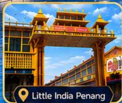
Little India Penang