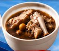
กะทุนเต๋