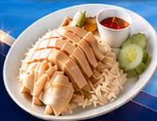
ข้าวมันไก่ปีนัง