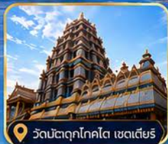
วัดมัตตุกโกโต เซดเตียร์