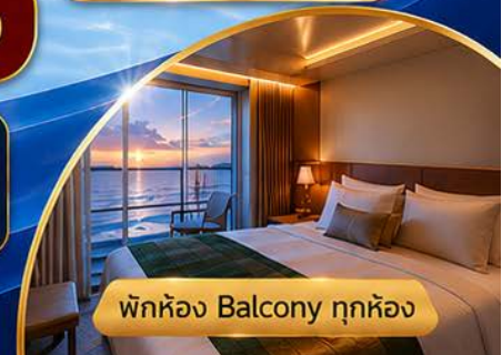
พักห้อง Balcony ทุกห้อง