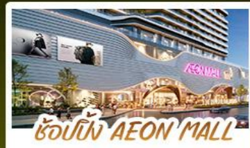
ช้อปปิ้ง AEON MALL