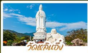
วัดเล่กั๊ว