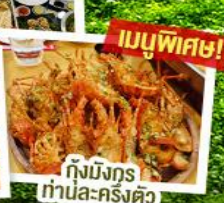
กึ่งมังกรก้านละครั้งตัว