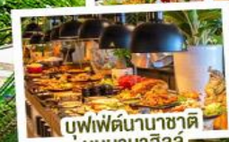
บุฟเฟ่ต์นานาชาติบนบานาฮิลล์