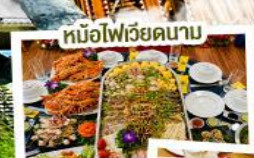
หม้อไฟเวียดนาม